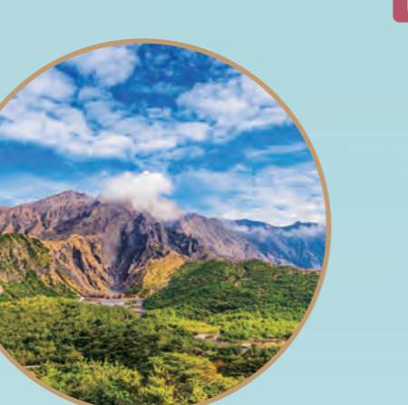
自然の恩恵を受けた、力強い光景 3 ROUTE