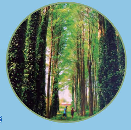
日本の原風景を想わせる 5 ROUTE