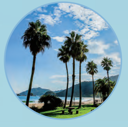
眼前に広がる、青い地平線 2 ROUTE