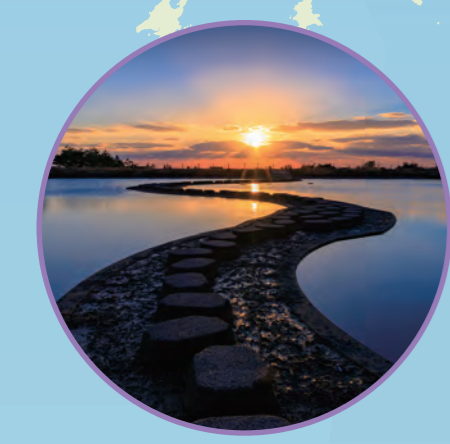
艶やかな夕日と、風情ある街並み 5 ROUTE